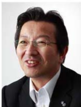
有限会社プロマックス 代表取締役