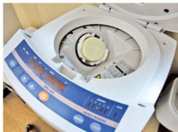
軟膏調剤・製剤機導入