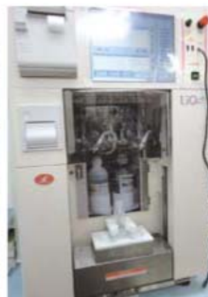
水剤定量分注機導入