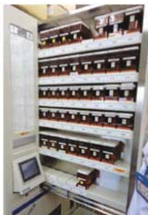
全自動錠剤分包機導入