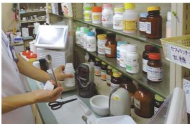
散剤監査システム導入